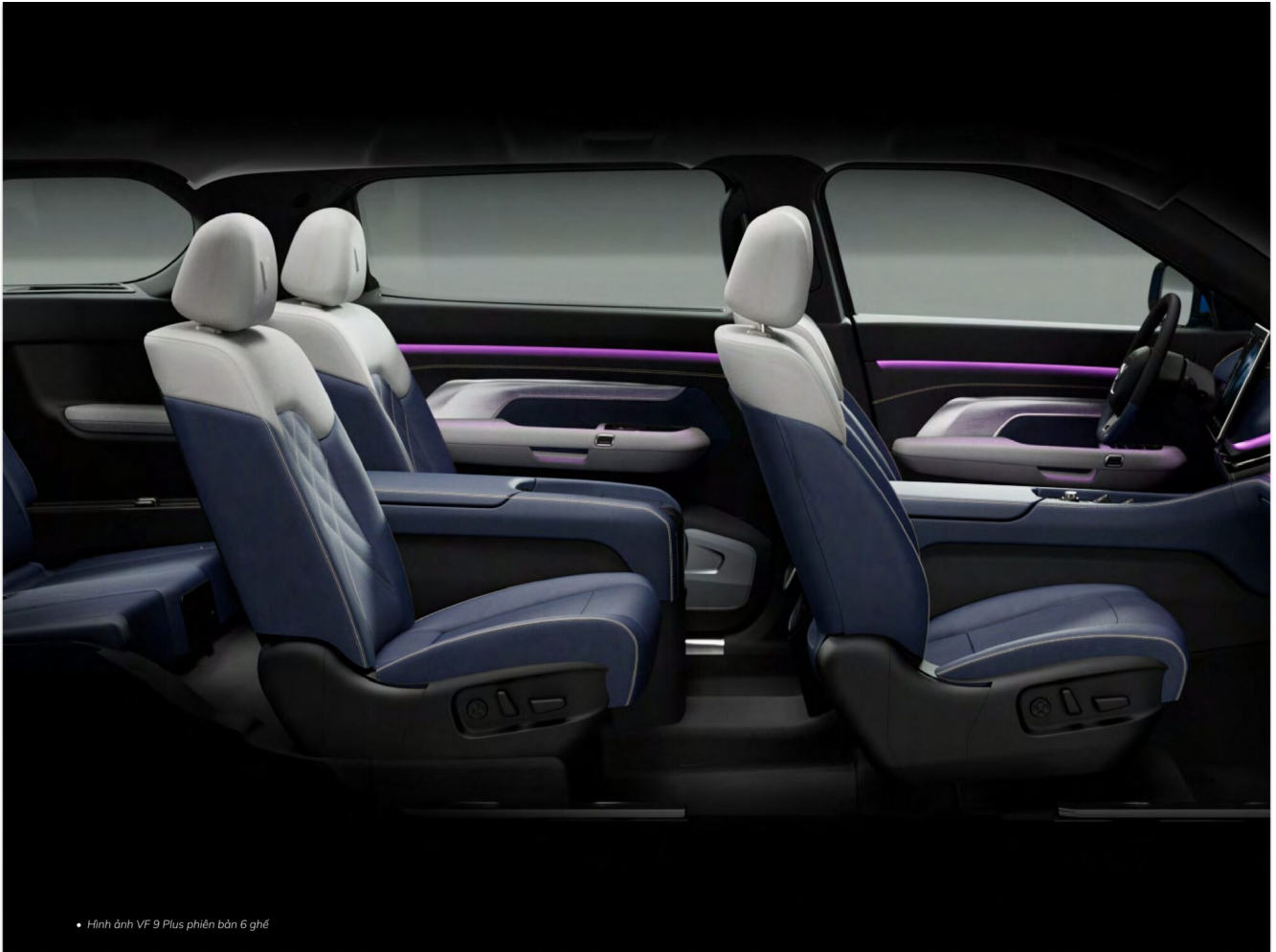
• Hình ảnh VF 9 Plus phiên bản 6 ghế